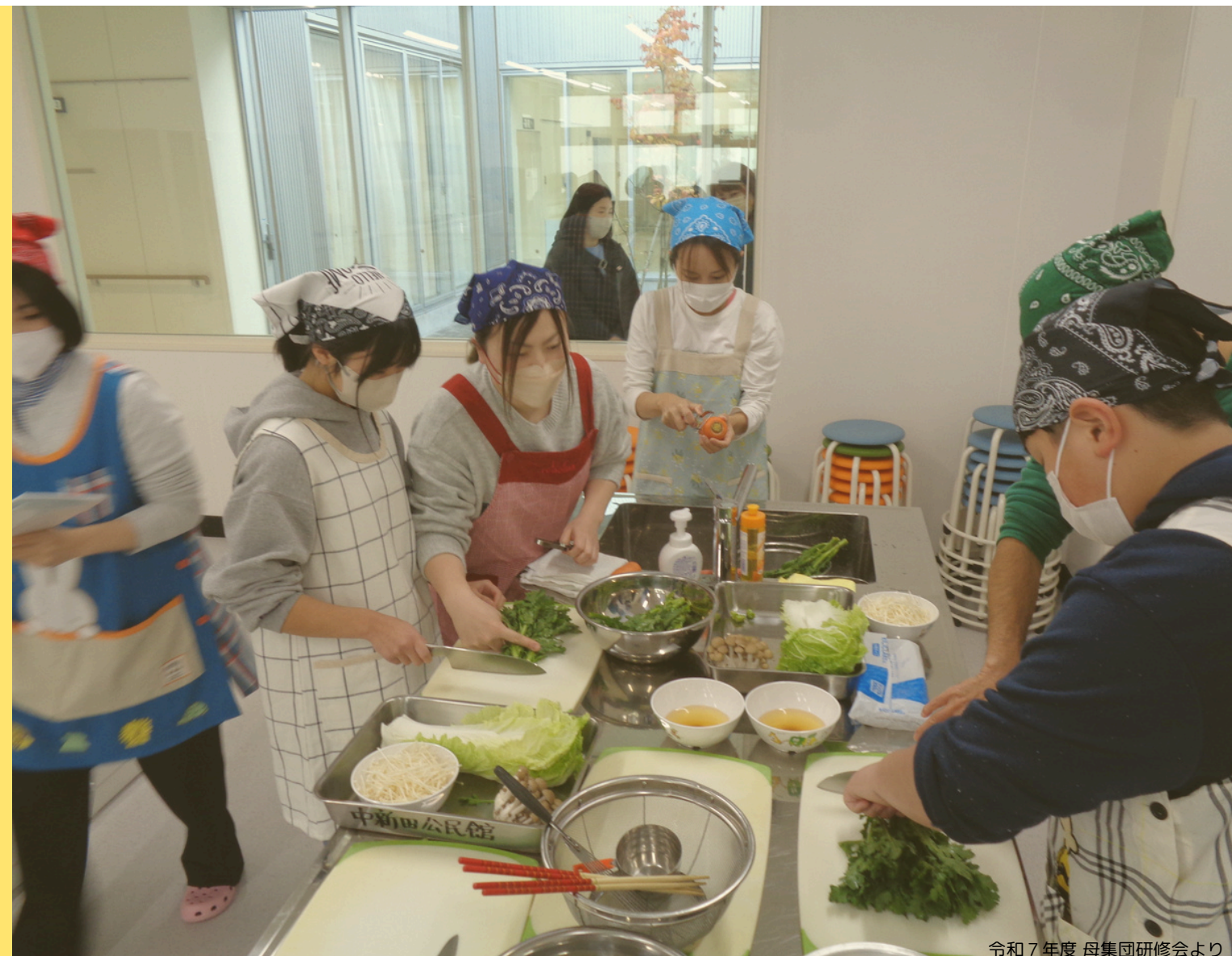
令和7年度 母集団研修会より

地域の子どもたちが学校以外の自由な時間に幅広いスポーツ活動を行う集まりです。活動を通じ、1人でも多くの子どもたちにスポーツの喜びや楽しさを体験することで、こころとからだの健全育成を図ります。また団員同士をはじめ地域社会とのつながりを形成する役割を担っています。所属する単位団のスポーツ活動以外に、全単位団(加美町スポーツ少年団)での活動にも参加していただきます。その他、町の事業への参加協力、奉仕作業などの地域社会に貢献する活動も行います。